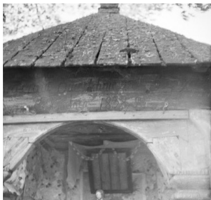
Kapliczka z 1838 roku, fundacji Małyszów, fot. J. Urbanowicz, 1961 r.

Bukowa jest dużą wsią położoną na północnym zachodzie od Biłgoraja. Pierwsze wzmianki o tej niezwykle pod względem historycznym i etnograficznym ciekawej wsi pochodzą już z XVI wieku. W przeszłości wioska była dzielona na przysiółki m.in. Małki, Myszaki. Po 1820 roku w wyniku reformy gruntowej, powstała tzw. Nowa Bukowa, czyli obecna wieś. W tej miejscowości znajdują się trzy niezwykle ciekawe kapliczki ludowe, które pochodzą aż z I połowy XIX wieku.