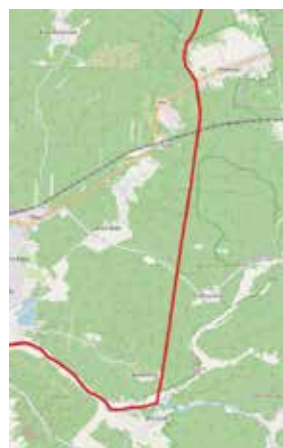
Dawna granica wyrysowana na współczesnej mapie topograficznej