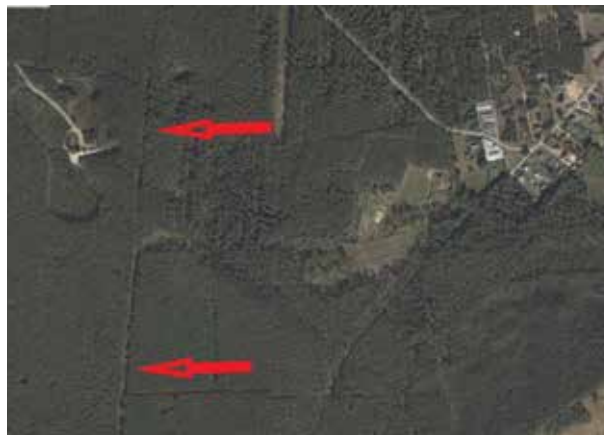
Linia graniczna widoczna na zdjęciu satelitarnym (geoportal.gov)